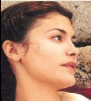
ロング・エンゲージメント